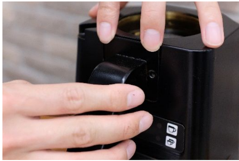
⑦ 取り外した部品を戻す