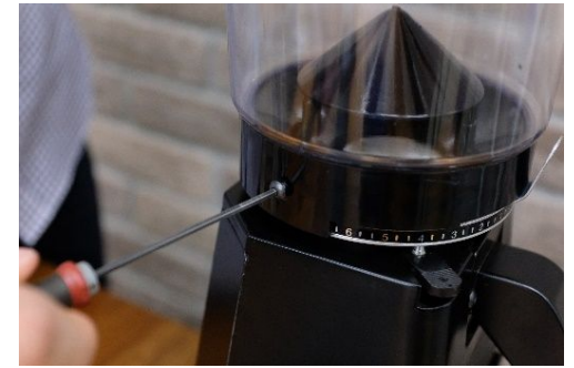
⑨ ネジの位置を確認しホッパーはめ 2箇所ネジを取り付けて作業完了