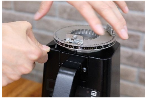
⑧ メッシュ調整ピンをセットし メッシュ調整ピンを押しながら 上刃を時計回りにまわす